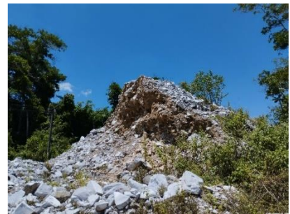
พื้นที่เก็บกองเปลือกดิน