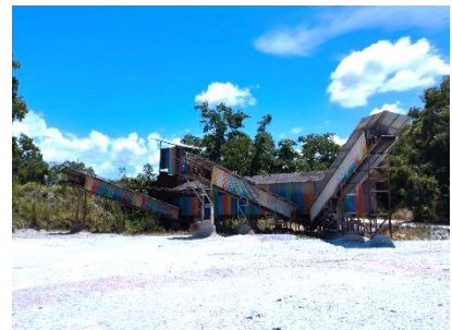
โรงแต่งแร่ของโครงการ