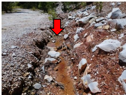
คูระบายน้ำ