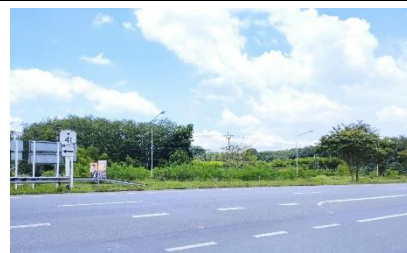
ทางหลวงหมายเลข 41