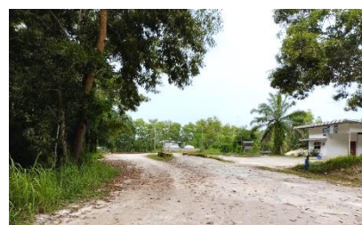
เส้นทางคมนาคมเข้า-ออกพื้นที่โครงการ