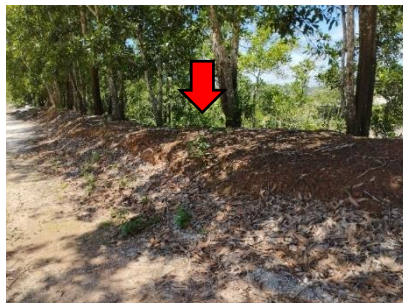
คันทำนบดิน