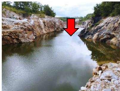
บ่อกักเก็บน้ำ (บ่อขุมเหมือง)