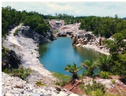
พื้นที่หน้าเหมือง